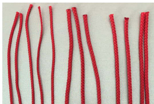
Materiali sintetici da tagliare a caldo